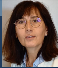
Élue de cœur et de conviction

▶ Composition du bureau départemental en page 4